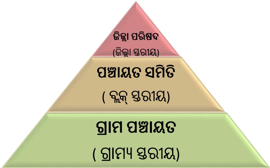
[ ତ୍ରିସ୍ତରୀୟ ପଞ୍ଚାୟତି ରାଜ ବ୍ୟବସ୍ଥା ]

ଏହି ସଂଶୋଧନ ଅନୁସାରେ, ଲୋକଙ୍କ ଆର୍ଥିକ ଉନ୍ନତିକୁ ବୃଦ୍ଧି କରିବା ତଥା ଦାରିଦ୍ର୍ୟ ଦୂରୀକରଣ ଯୋଜନା ଗୁଡ଼ିକର ସଫଳ ରୂପାୟନ ନିମନ୍ତେ ପଞ୍ଚାୟତି ରାଜ ସଂସ୍ଥାକୁ ନେଇ ପ୍ରଚଳିତ ଅନୁନିୟମ ଯଥା ଗ୍ରାମ୍ୟ ସ୍ତରରେ ଥିବା ଗ୍ରାମ ପଞ୍ଚାୟତ ପାଇଁ “ଓଡ଼ିଶା ଗ୍ରାମ ପଞ୍ଚାୟତ ଅନୁନିୟମ ୧୯୭୪”, ମଧ୍ୟବର୍ତ୍ତୀ ସ୍ତରରେ ଥିବା ପଞ୍ଚାୟତ ସମିତି ପାଇଁ “ଓଡ଼ିଶା ପଞ୍ଚାୟତ ସମିତି ଅନୁନିୟମ ୧୯୫୯” ଓ ଜିଲ୍ଲା ପରିଷଦ ପାଇଁ “ଓଡ଼ିଶା ଜିଲ୍ଲା ପରିଷଦ ଅନୁନିୟମ ୧୯୯୯” ରେ ଓଡ଼ିଶା ସରକାରଙ୍କ ଦ୍ୱାରା ଉପଯୁକ୍ତ ସଂଶୋଧନ କରାଯାଇଛି ।